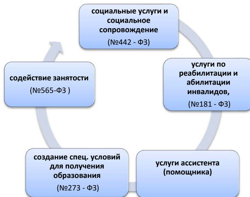
Рисунок 4 – Комплекс услуг и мероприятий, предоставляемых инвалиду на сопровождаемом проживании

Услуги и/или мероприятия в рамках сопровождаемого проживания предоставляются на весь срок нуждаемости инвалида в сопровождаемом проживании.