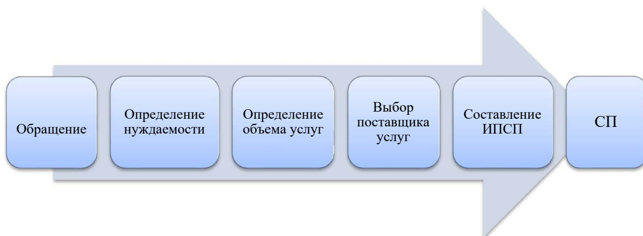
Рисунок 1 – Порядок определения гражданина на сопровождаемое проживание

Ниже представлен порядок определения гражданина на сопровождаемое проживание (рис. 1).